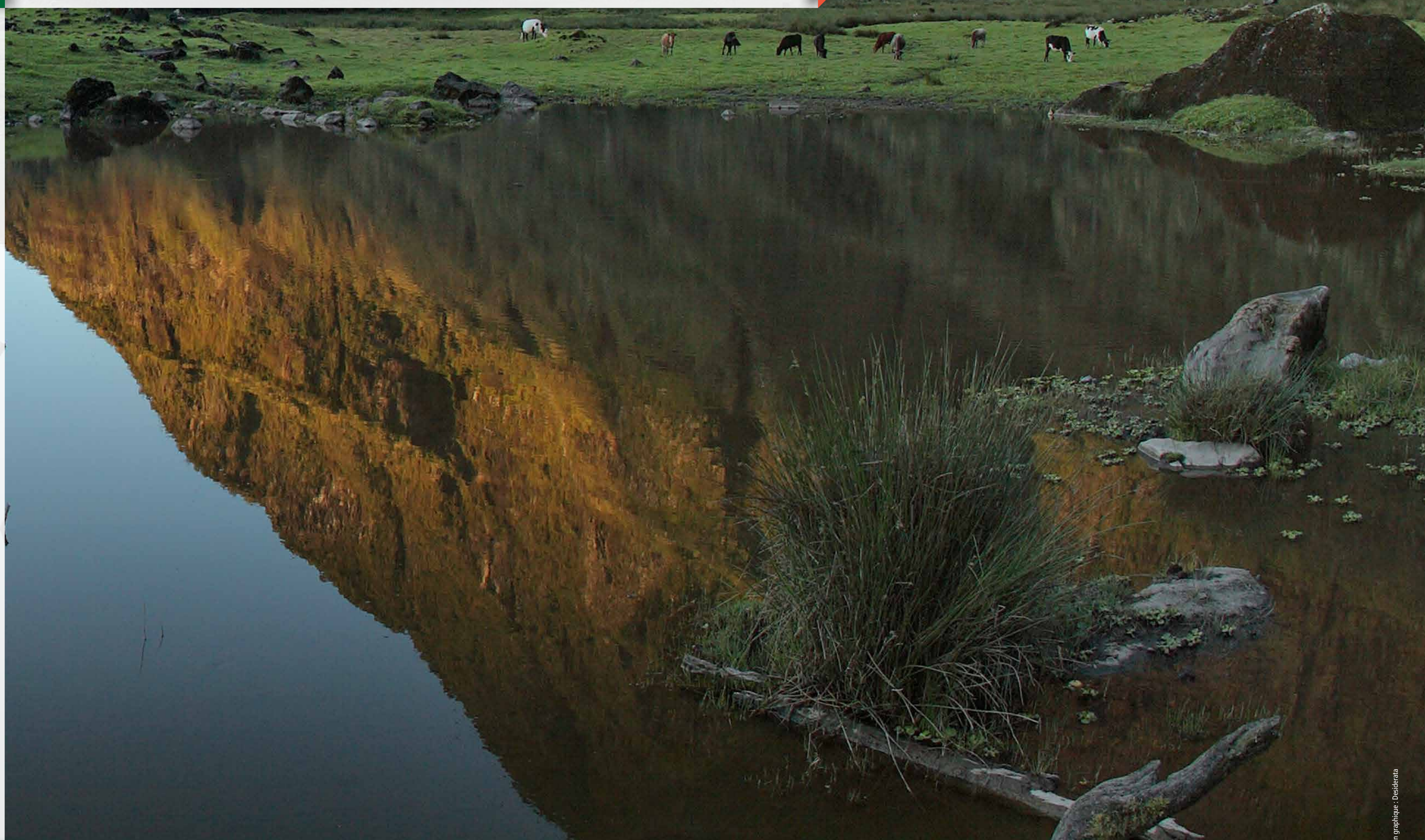
1 Pétrel de Barau aux abords de son terrier. 2 Relâcher de Pétrel de Barau sur le littoral sud de La Réunion par un agent du Parc national.

La réduction de la pollution lumineuse est identifiée comme prioritaire pour la conservation des deux pétrels endémiques et emblématiques de la biodiversité réunionnaise. L'action contribue ainsi clairement à « préserver les espèces et leur diversité » (Objectif 4 de la SNB).