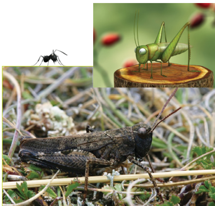
Le véritable criquet des Causses (mêlez-vous des imitations, exigez la véritable Oedipode caussenarde) qui a signé une alliance avec les chevaux

Le résultat de leurs pérégrinations ? Un peu plus de diversité dans la prairie parcourue par les équidés : 20 espèces contre 16. Mais aussi un de cette bande de « Minuscule » très « sélect » : un criquet qui ne fréquente QUE les causses. Par le pâturage, le piétinement, mais aussi leur crottin, les chevaux modifient leur milieu. Les différentes espèces de sauterelles et criquets, qui sont sensibles à ces subtiles nuances, sont impactées par les herbivores. CQFD. Etonnant non ?