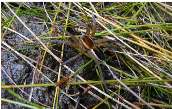
L'araignée sauteuse (qui n'arrive jamais à attraper la moindre mouche) et l'araignée rousse (qui attend sa proie au milieu de sa toile, sans bouger...) sont fort intéressées par un stage pratique avec la Dolomède.