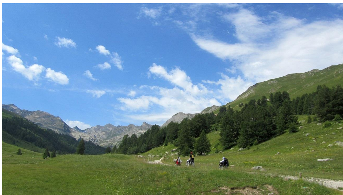
Sentier du Lauzanier accessible