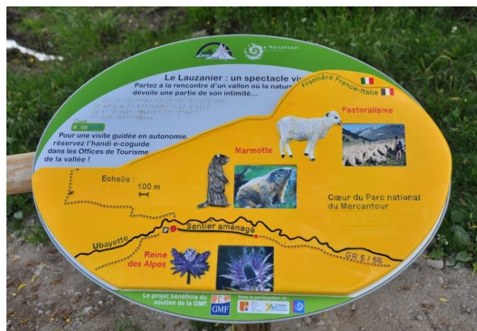
Table de lecture sensorielle

Pour les non-brailleuses, un complément audio propose une lecture du paysage du vallon.