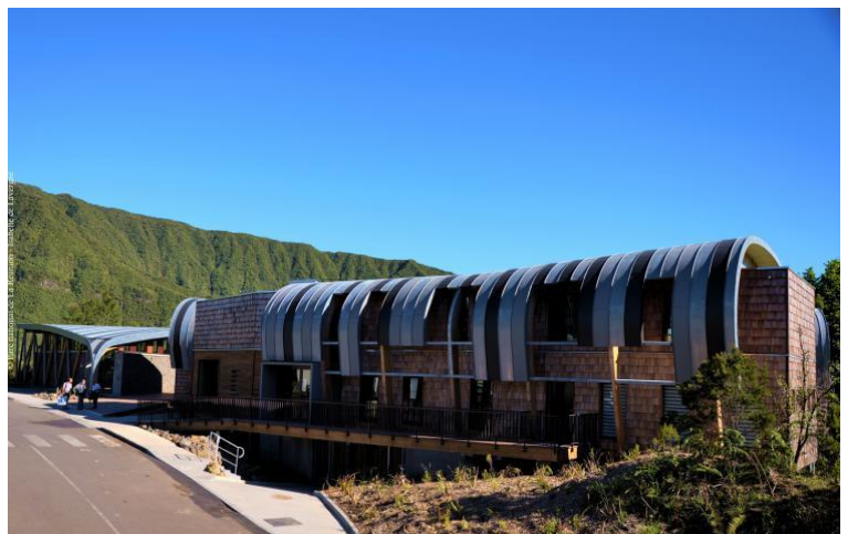
Maison du PNRun

La visite s'achève dans les jardins abritant une centaine d'espèces végétales indigènes et endémiques.